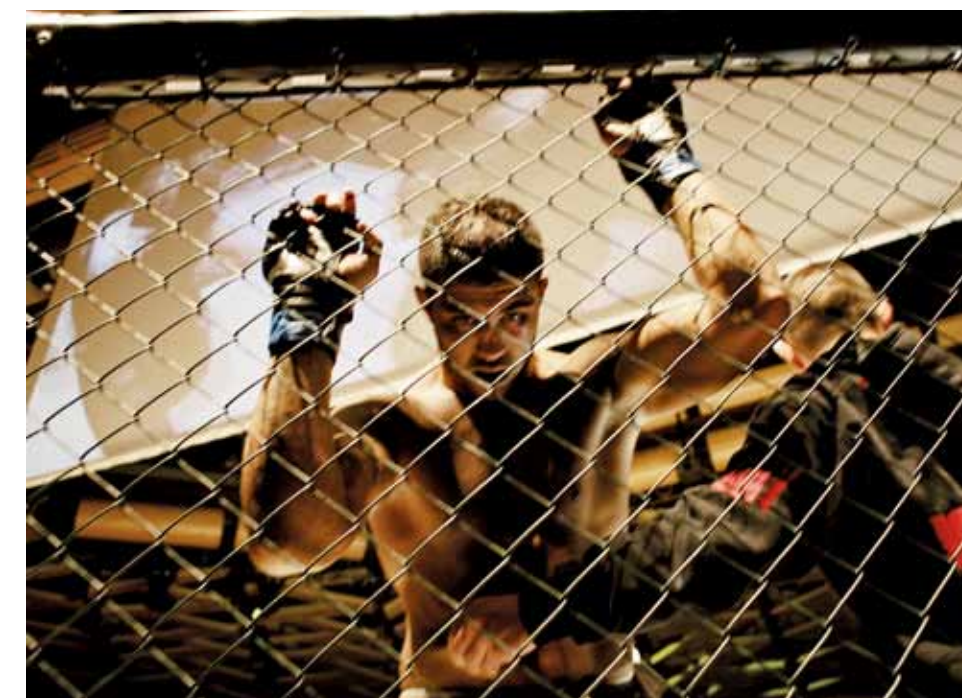
Le „gladiateur” se présente au public et aux arbitres. Le prochain match peut débuter.