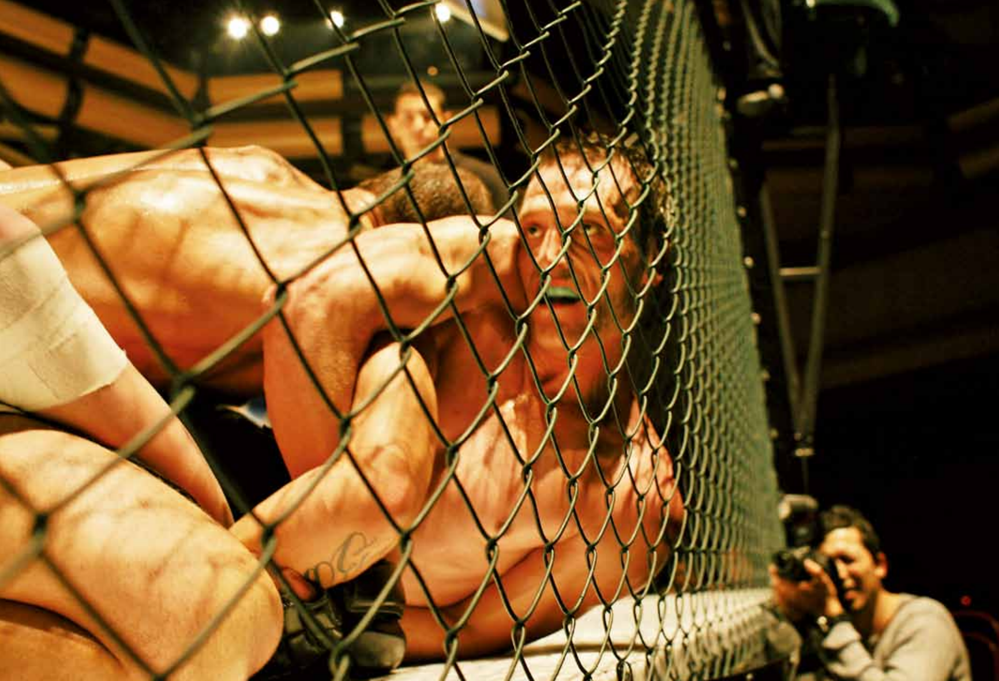
Sur le ring conçu comme une cage, un combat fait rage.