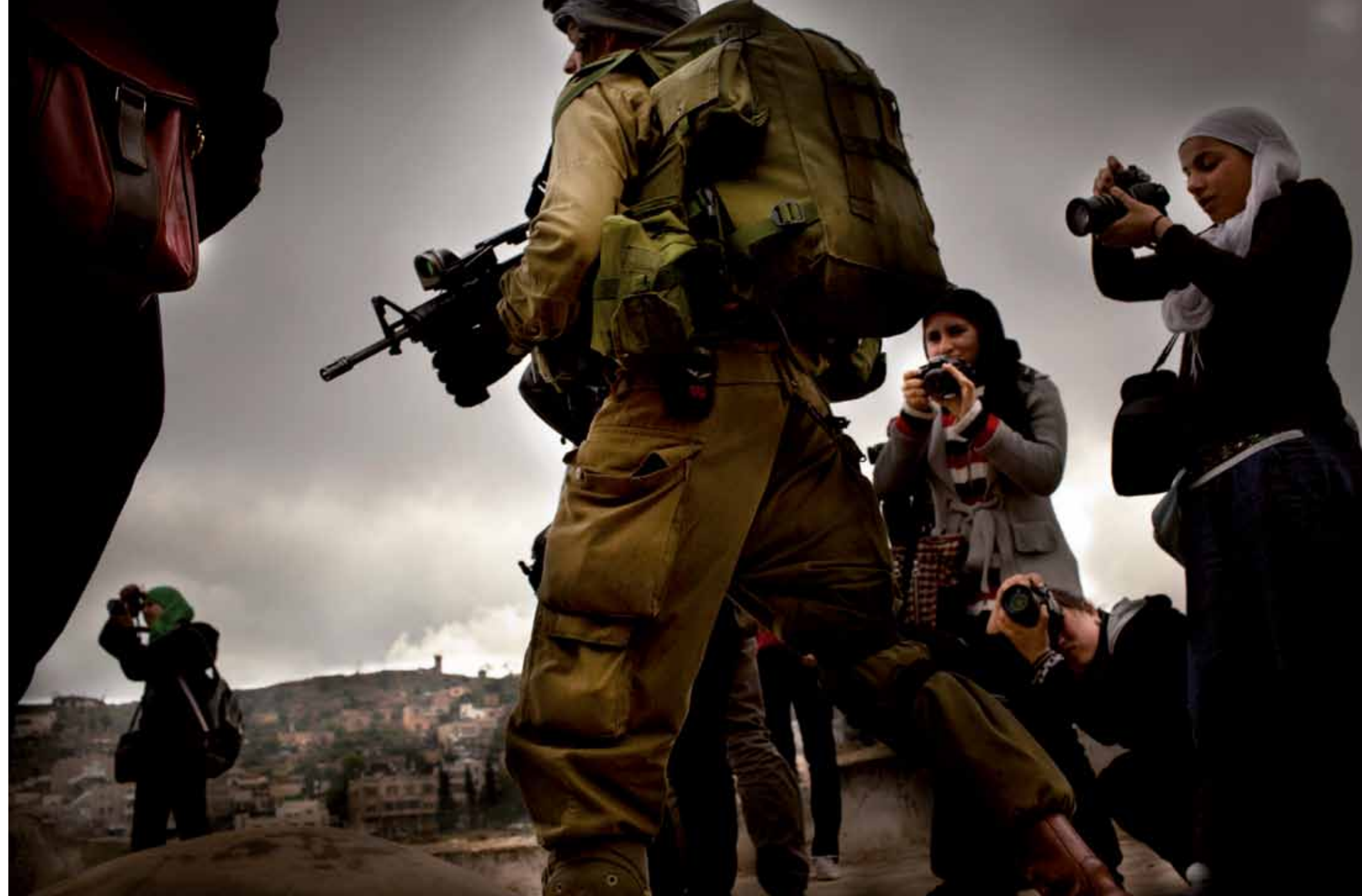
Kursteilnehmerinnen an der Arbeit in Hebron, Betlehem und im Flüchtlingscamp in Jenin.

Hebron: Als junge Palästinenserinnen auf einem Dach fotografieren tauchen alarmierte israelische Soldaten auf. Die Frauen setzen ihre Fotoarbeit fort, und die Soldaten ziehen ab.