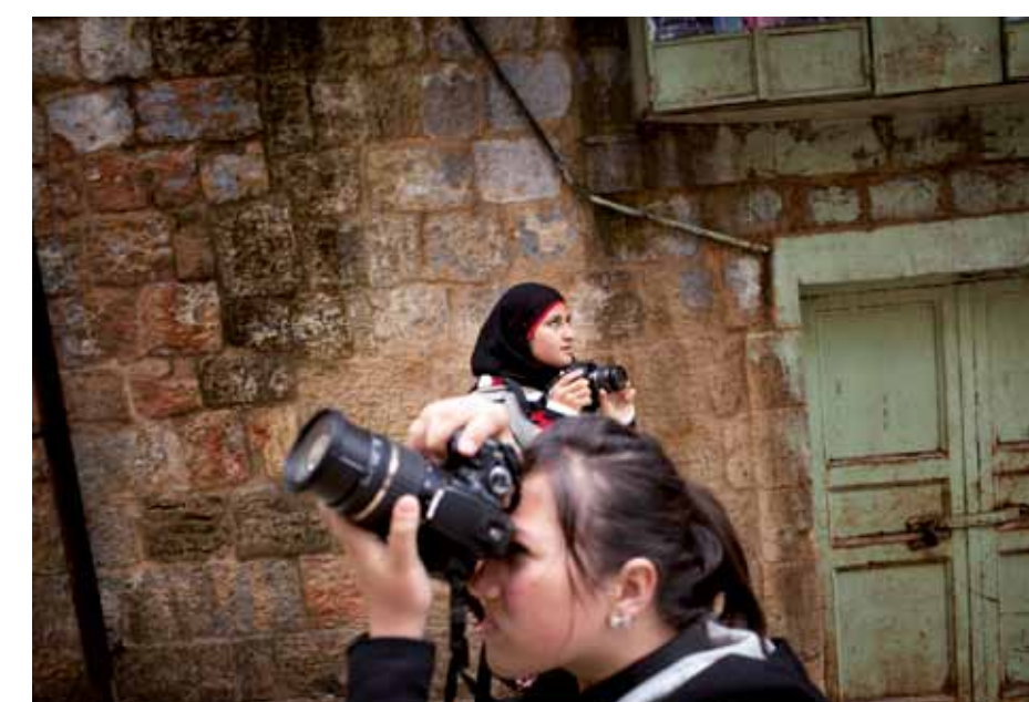
Motiv-Suche in Hebron und Jenin.