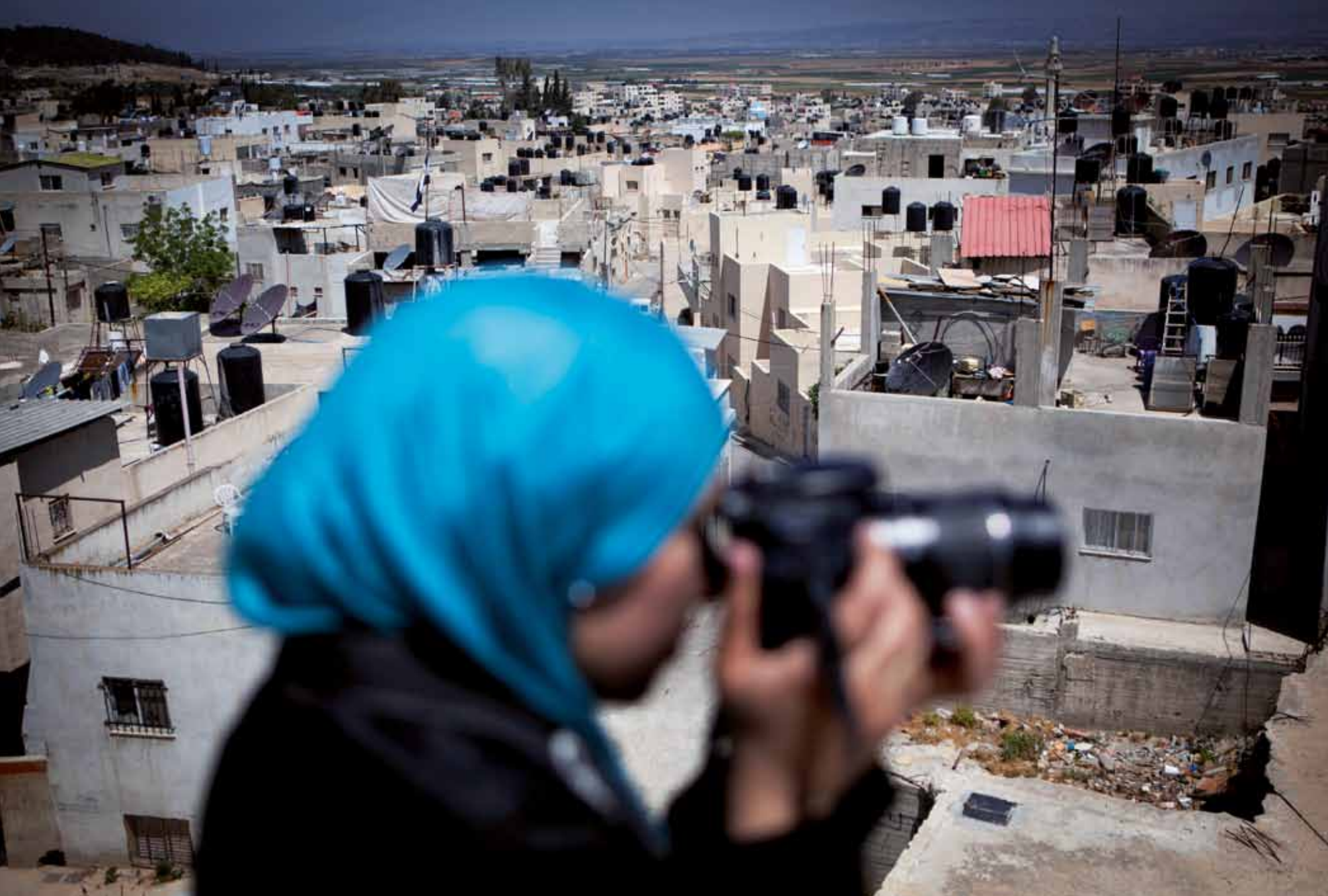
Flüchtlingscamp in Jenin, Westbank. Es besteht seit 1953 und hat circa 20 000 palästinensische Bewohner.